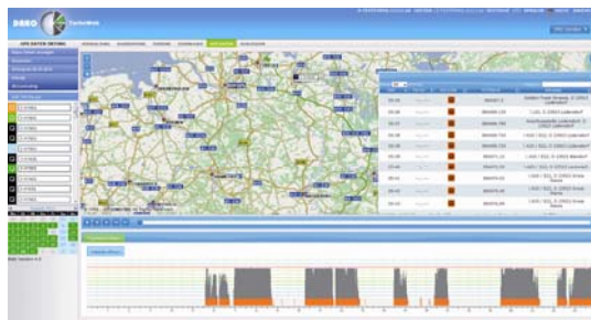
Ansicht TachoWeb (Spurverfolgung)